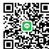
QR-code การเงินวามินทร์วิทยา

ชื่อบัญชีโรงเรียนวามินทร์วิทยา (ฮัวเหมิง) เลขบัญชี 362-0-02687-4 สำหรับผู้ปกครองที่ชำระค่าเล่าเรียนผ่านบัญชีธนาคารโรงเรียน สามารถแจ้งสลิปการโอนเงินผ่าน QR-code การเงินได้โดยตรง